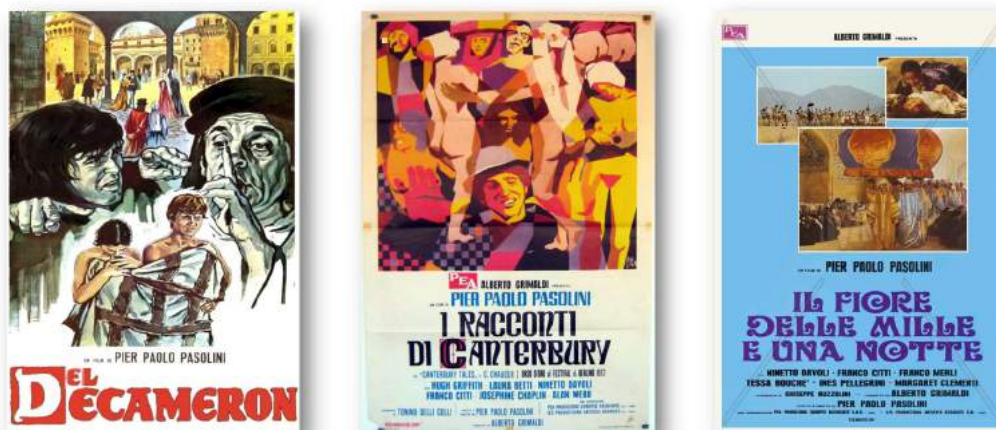
Figura. 2. Carteles de las películas “El Decamerón”, “Los cuentos de Canterbury” y “Las mil y una noches” [Grimaldi (productor) y Pasolini (director) (1971, 1972 y 1974)].