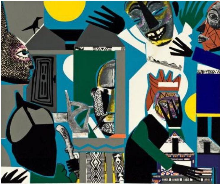
R. Bearden (s.f.). Sorcerer's Village (Sorcerer) [Collage].